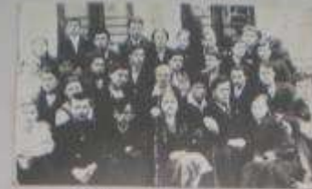
10 й класс. 1941 г.