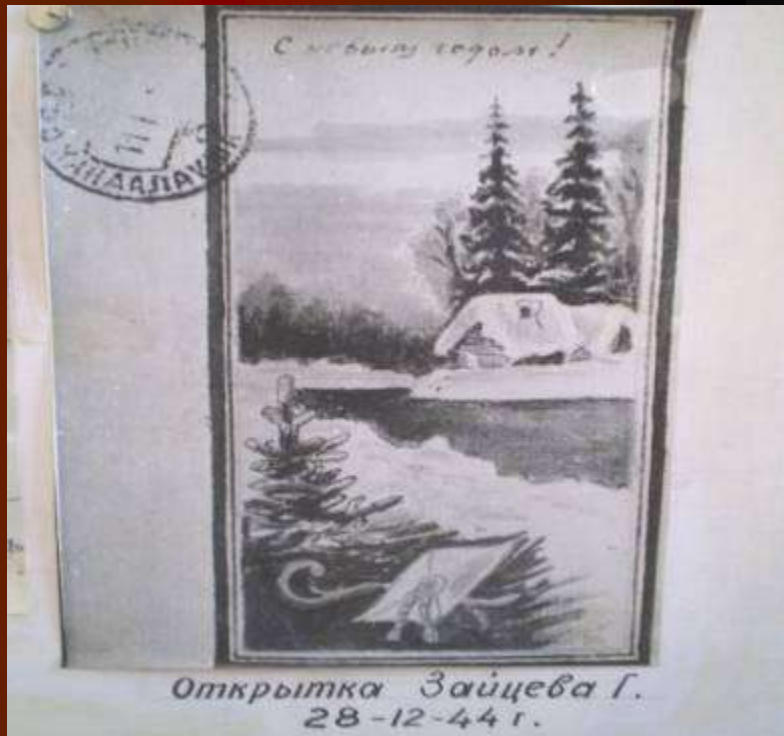
Открытка Зайцева Г. 28-12-44 г.